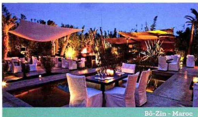
B6-Zin - Maroc