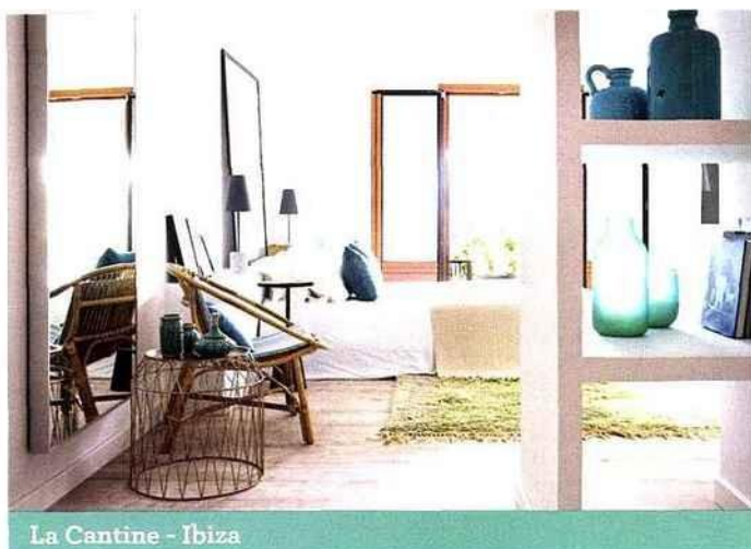
La Cantine - Ibiza