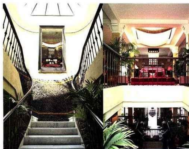
Le Grand Café de la Poste - Maroc

105, La Cantine du Faubourg Dubaï. lacantine.ae