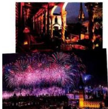
Tous droits réservés à l'éditeur

Le spectacle pyrotechnique tiré le 31 décembre près du Coca-Cola London Eye réunit chaque année des centaines de milliers de personnes à Trafalgar Square et sur les bords de la Tamise. Pour y assister, il faut absolument réserver un billet (11,40 £, london.gov.uk/nye ou visitlondon.com ). On peut aussi profiter du spectacle depuis la terrasse du Roof Gardens, à Kensington. Au menu, feu d'artifice, champagne, quatre plats, vin, dancefloor, numéro de cirque et petit-déjeuner servi à 2 heures du matin, 285 € la soirée par personne. The Roof Gardens, 99 Kensington High St, Kensington, Tél. +44 20 73 68 39 93, virginlimitededition.com Great Northern Hotel, 406 € la nuit le 31 décembre avec bouteille de champagne Billecart-Salmon offerte et cuisine garnie en libre-service à toute heure. Pancras Rd, King's Cross. Tél. +44 20 33 88 08 00, hondon.com/London